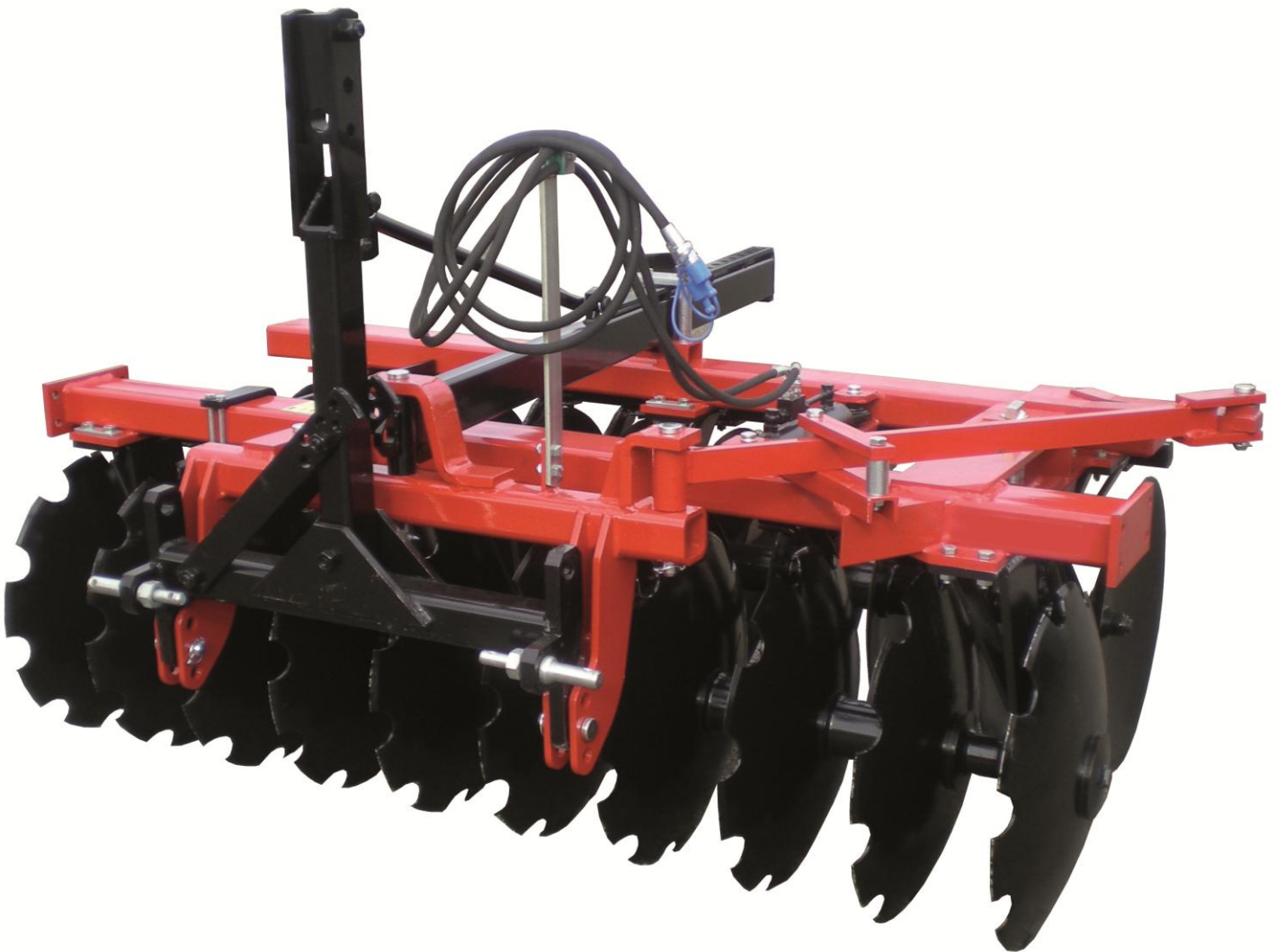
Frangizolle a 2 sezioni a V portato-trainato - Apertura Idraulica Herse deux sections porte/trainee - Ouverture hydraulique Pulverizer two "V" sections - Hydraulic section angle adjustment