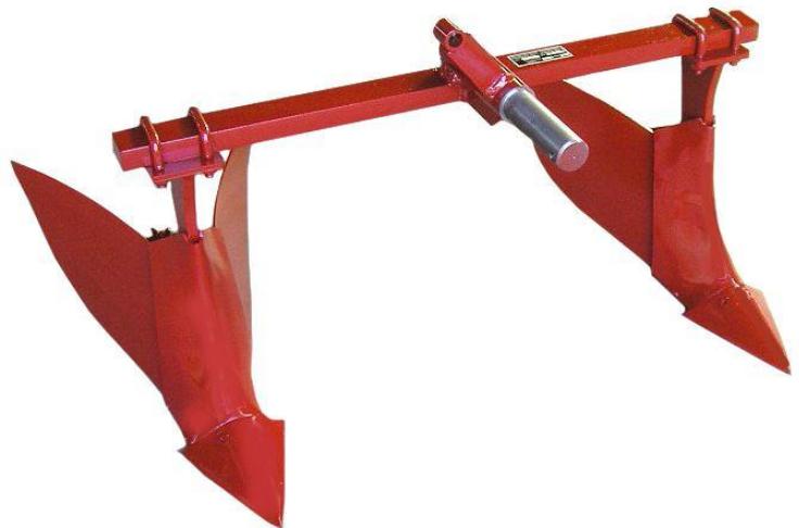
Assolcatore doppio AS2-10R Butteur double AS2-10R Two elements ridger AS2-10R