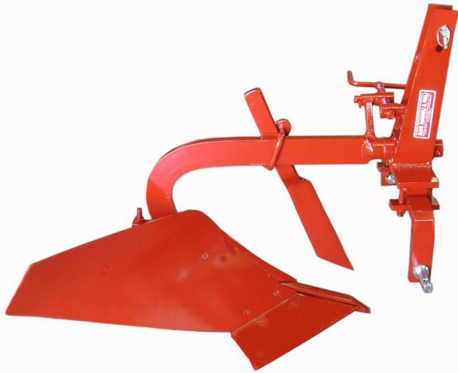
Aratro monovomere MDS con attacco AT/3P Carrue monosoc MDS soc à carcelet Single furrow chisel plough MDS

Attrezzature per trattori da 15 a 45 CV. (serie fissa) Charrue pour tracteur 15-45 CV. - Plough for tractor 15-45 HP