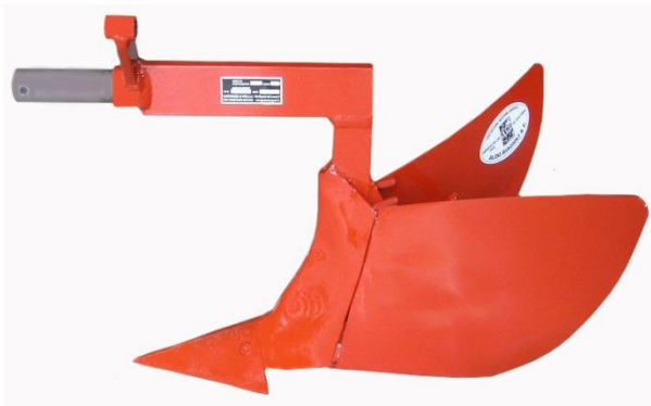
Assolcatore semplice AS1 Butteur AS1 Ridger AS1