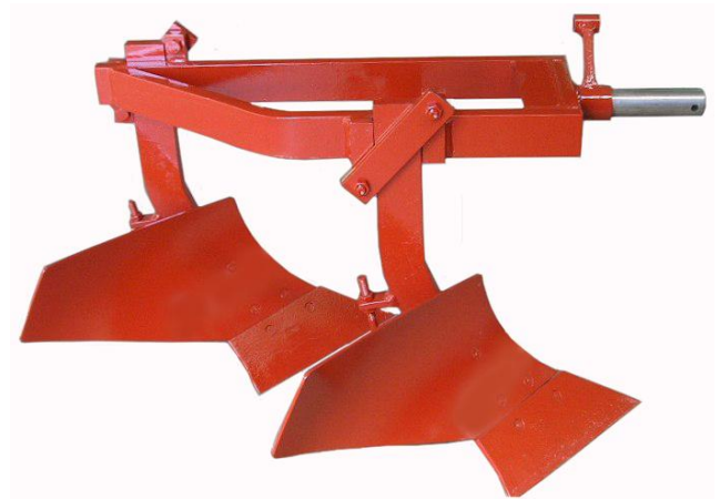
Aratro bivomere 2D Charrue bisoc 2D soc ordinaires Two furrow plough 2D standard share