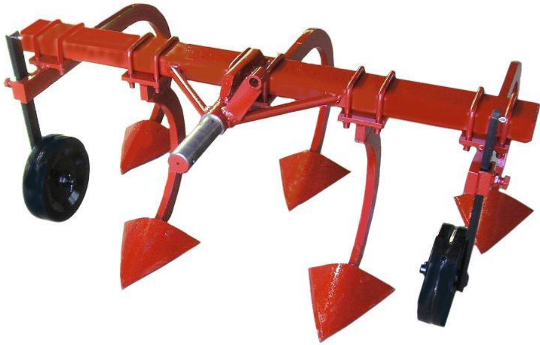
Estirpatore ETB-20 con ruotini Cultivateur ETB-20 avec roues Mounted grubber ETB-20 with wheels